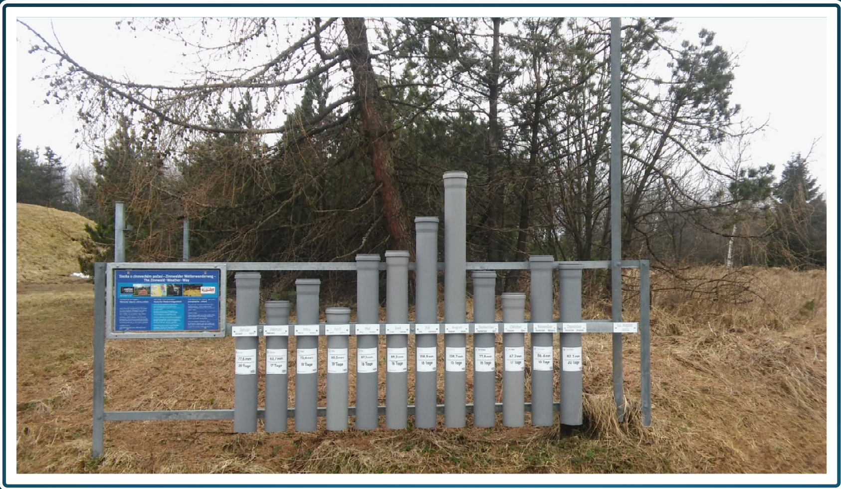
Die „Regenröhren“ 2017 – „Hommage“ an den Niederschlagsrekord 2002