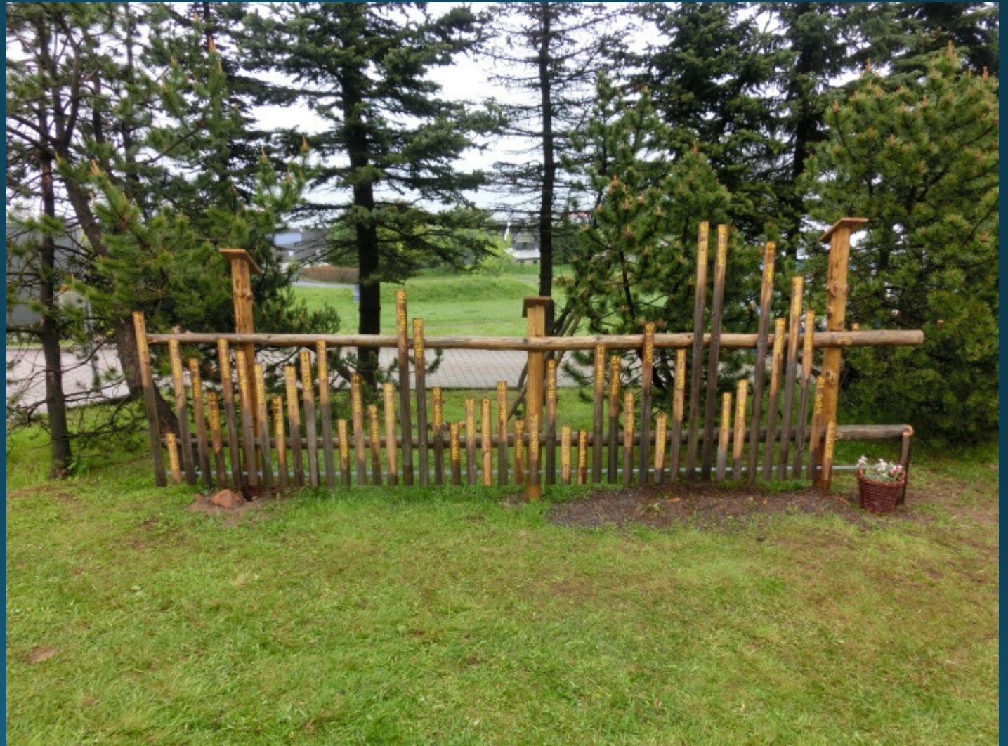
Bau des Schneehöhenzauns 2014